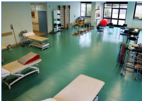
La Palestra FKT