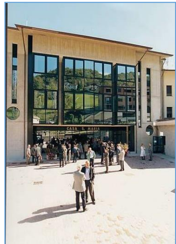
29 settembre 1999 Inaugurazione struttura

È completamente immersa nel verde dell'altopiano dove sorge, con alcune cime delle Prealpi Orobie che le fanno da cornice.